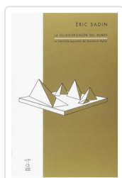
SILICONIZACION DEL MUNDO, LA SADIN, ERIC