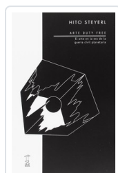
ARTE DUTY FREE STEYERL, HITO