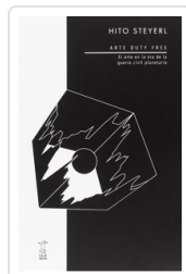
ARTE DUTY FREE STEYERL, HITO