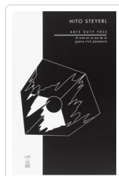
ARTE DUTY FREE STEYERL, HITO