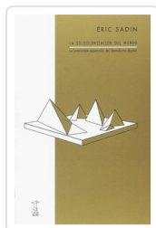
SILICONIZACION DEL MUNDO, LA SADIN, ERIC