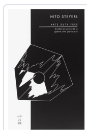
ARTE DUTY FREE STEYERL, HITO