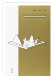
SILICONIZACION DEL MUNDO, LA SADIN, ERIC