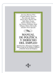
MANUAL DE POLÍTICA Y DERECHO DEL EMPLEO JOSE LUIS MONEREO PEREZ