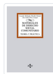
MATERIALES DE DERECHO SOCIAL COMUNITARIO LOURDES MELENDEZ MORILLO-VELARDE