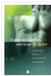
CURAR EL CUERPO ELIMINAR DOLOR SARNO, JOHN