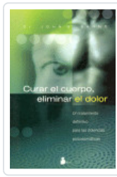
CURAR EL CUERPO ELIMINAR DOLOR SARNO, JOHN