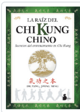
RAIZ DEL CHI KUNG CHINO YANG, JWING-MING