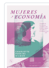
MUJERES Y ECONOMIA. ESTUDIO RELACIONES ECONOMICAS ENTRE HOM PERKINS, CHARLOTTE