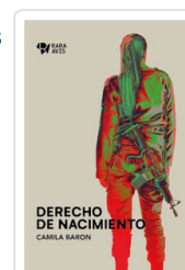
DERECHO DE NACIMIENTO. CRONICAS DE ISRAEL Y PALESTINA BARON, CAMILA