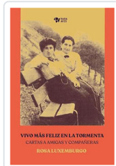
VIVO MAS FELIZ EN LA TORMENTA. CARTAS A AMIGAS Y COMPAÑERAS LUXEMBURGO, ROSA