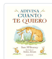
ADIVINA CUANTO TE QUIERO MCBRATNEY, SAM