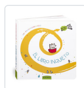
LIBRO INQUIETO, EL KRICKELKRAKELS