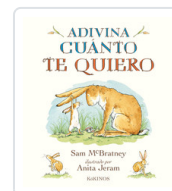
ADIVINA CUANTO TE QUIERO MCBRATNEY, SAM