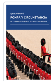
POMPA Y CIRCUNSTANCIA. DICCIONARIO SENTIMENTAL CULTURA ING PEYRO, IGNACIO