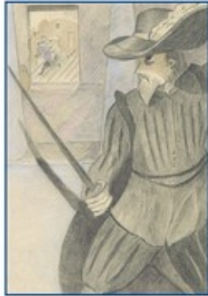
Tirso de Molina El condenado por desconfiado