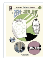
ZEN DE STEVE JOBS FORBES