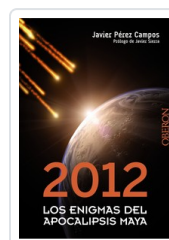
2012. LOS ENIGMAS DEL APOCALIPSIS MAYA JAVIER PEREZ CAMPOS