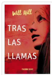
TRAS LAS LLAMAS HILL, WILL