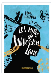
NIÑOS DE WILLESDEN, LOS GOLABEK, MONA