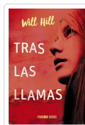
TRAS LAS LLAMAS HILL, WILL