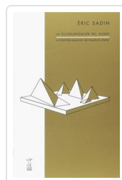
SILICONIZACION DEL MUNDO, LA SADIN, ERIC