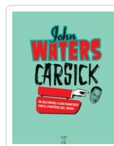
CARSICK DE BALTIMORE Y A SAN FRANCISCO WALTERS, JOHN