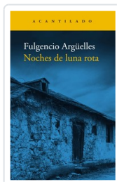
NOCHES DE LUNA ROTA ARGUELLES, FULGENCIO