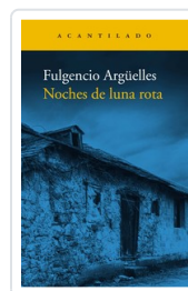
NOCHES DE LUNA ROTA ARGUELLES, FULGENCIO