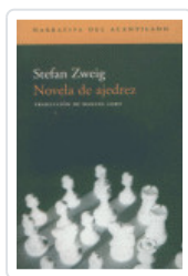
NOVELA DE AJEDREZ ZWEIG, STEFAN