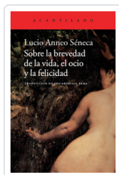
SOBRE LA BREVEDAD DE LA VIDA, EL OCIO Y LA FELICIDAD SENECA, LUCIO A.