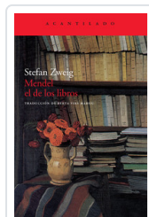
MENDEL EL DE LOS LIBROS ZWEIG, STEFAN