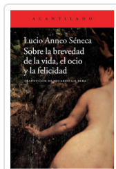
SOBRE LA BREVEDAD DE LA VIDA, EL OCIO Y LA FELICIDAD SENECA, LUCIO A.