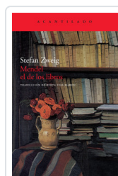
MENDEL EL DE LOS LIBROS ZWEIG, STEFAN