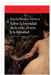
SOBRE LA BREVEDAD DE LA VIDA, EL OCIO Y LA FELICIDAD SENECA, LUCIO A.