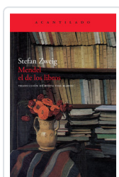
MENDEL EL DE LOS LIBROS ZWEIG, STEFAN