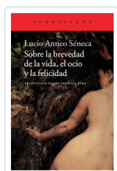
SOBRE LA BREVEDAD DE LA VIDA, EL OCIO Y LA FELICIDAD SENECA, LUCIO A.