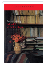
MENDEL EL DE LOS LIBROS ZWEIG, STEFAN