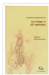
LO PURO Y LO IMPURO JENKELEVITCH, VLADIMIR