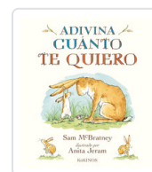
ADIVINA CUANTO TE QUIERO MCBRATNEY, SAM