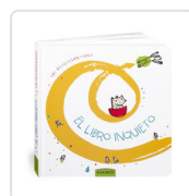
LIBRO INQUIETO, EL KRICKELKRAKELS