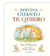
ADIVINA CUANTO TE QUIERO MCBRATNEY, SAM