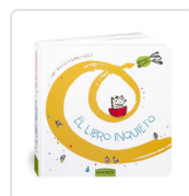
LIBRO INQUIETO, EL KRICKELKRAKELS