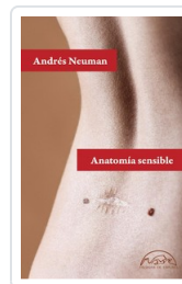
ANATOMIA SENSIBLE NEUMAN, ANDRES