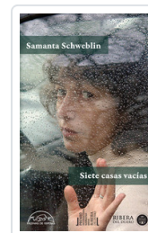
SIETE CASAS VACIAS SCHWEBLIN, SAMANTA