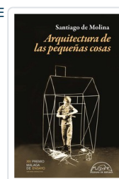
Santiago de Molina Arquitectura de las pequeñas cosas ARQUITECTURA DE LAS PEQUEÑAS COSAS DE MOLINA, SANTIAGO