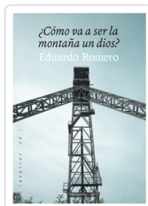
¿Cómo va a ser la montaña un dios? ROMERO, EDUARDO