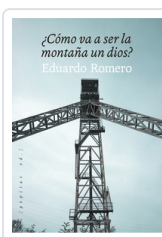
COMO VA A SER LA MONTAÑA UN DIOS? ROMERO, EDUARDO