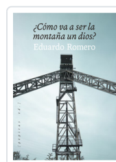
COMO VA A SER LA MONTAÑA UN DIOS? ROMERO, EDUARDO