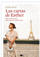
CARTAS DE ESTHER, LAS PIVOT, CECILE