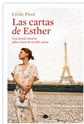
CARTAS DE ESTHER, LAS PIVOT, CECILE