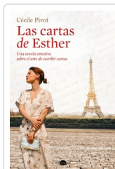
CARTAS DE ESTHER, LAS PIVOT, CECILE