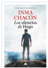
SILENCIOS DE HUGO, LOS CHACON, INMA