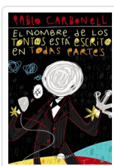
NOMBRE DE LOS TONTOS ESTA ESCRITO EN TODAS PARTES, EL CARBONELL, PABLO