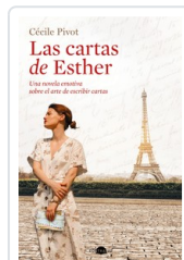
CARTAS DE ESTHER, LAS PIVOT, CECILE