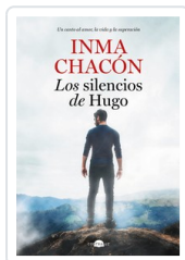
SILENCIOS DE HUGO, LOS CHACÓN, INMA