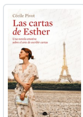
CARTAS DE ESTHER, LAS PIVOT, CECILE