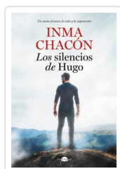
SILENCIOS DE HUGO, LOS CHACON, INMA