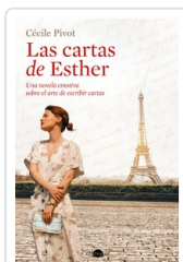
CARTAS DE ESTHER, LAS PIVOT, CECILE