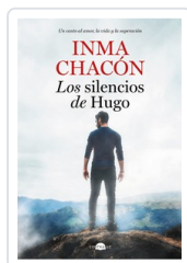
SILENCIOS DE HUGO, LOS CHACÓN, INMA