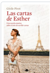
CARTAS DE ESTHER, LAS PIVOT, CECILE