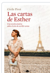
CARTAS DE ESTHER, LAS PIVROT, CECILE