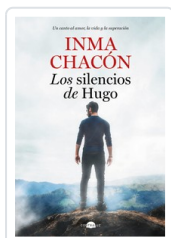
SILENCIOS DE HUGO, LOS CHACÓN, INMA