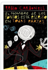
NOMBRE DE LOS TONTOS ESTA ESCRITO EN TODAS PARTES, EL CARBONELL, PABLO