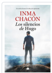
SILENCIOS DE HUGO, LOS CHACÓN, INMA