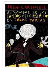
NOMBRE DE LOS TONTOS ESTA ESCRITO EN TODAS PARTES, EL CARBONELL, PABLO