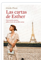
CARTAS DE ESTHER, LAS PIVOT, CECILE