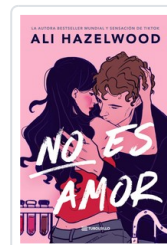
NO ES AMOR (BOL) HAZELWOOD, ALI