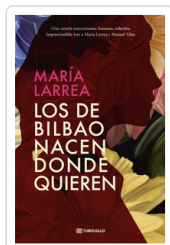
LOS DE BILBAO NACEN DONDE QUIEREN (BOL) LARREA, MARIA