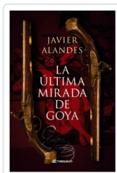
ULTIMA MIRADA DE GOYA, LA (BOL) ALANDES, JAVIER