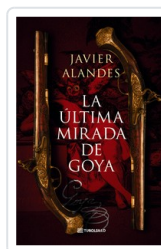
ULTIMA MIRADA DE GOYA, LA (BOL) ALANDES, JAVIER