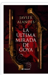
ULTIMA MIRADA DE GOYA, LA (BOL) ALANDES, JAVIER