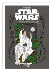
ARTETERAPIA. STAR WARS HACHETTE HEROES