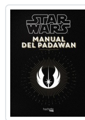
MANUAL DEL PADAWAN NICOLAS BEAUJOUAN