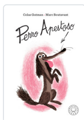
PERRO APESTOSO GUTMAN, COLAS