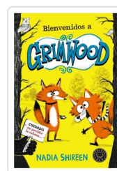
BIENVENIDOS A GRIMWOOD SHIREEN, NADIA